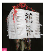
1.「長谷川等伯翁 佛涅槃図」尾之善／2.「伊藤若冲翁 棕櫚雄鶏図」尾之善／3. 伊勢型紙（当館所蔵）／4. 中設楽花祭「ぎげち」（豊橋市美術館所蔵）／5. 下黒川花祭「ゆふた」（豊橋市美術館所蔵）／6. ～ 8. 中国の剪紙（名古屋大学博物館所蔵）

【表面】中央より左回り「神君家康公像」／「小林地区 山見鬼」／「小林地区 茂吉鬼」／「岡崎龍城」すべて尾之善